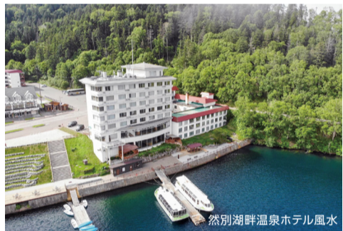
然別湖畔温泉ホテル風水